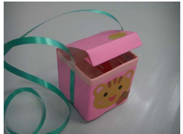
牛乳パックで作ったお散歩用バック

バックを持ってお散歩に行ってみましょう♪ きっとバックは、木の実や枯れ葉でいっぱいになるでしょうね\(^o^)/